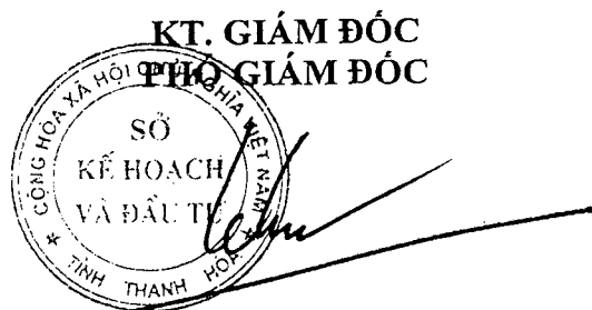
Lê Thanh Hải