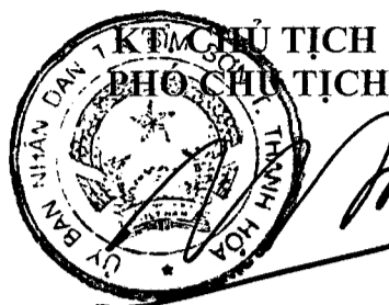
Tổng Thanh Bình

trên địa bàn quản lý; xử lý kịp thời hoặc kiến nghị biện pháp xử lý đối với các hành vi vi phạm pháp luật về BVMT.