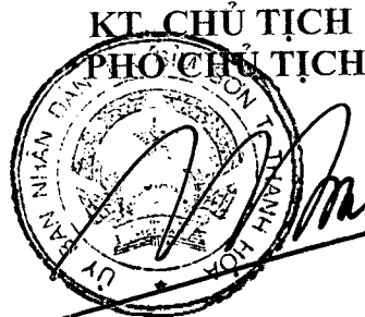
Tổng Thanh Bình