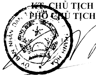
Tổng Thanh Bình